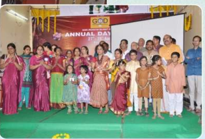
G.O.D. இந்தியா டிரஸ்டின் 3வது ஆண்டு விழா பெங்களூர் மல்வேஸ்வரம் - ஏப்ரல் 27, 28, 2013