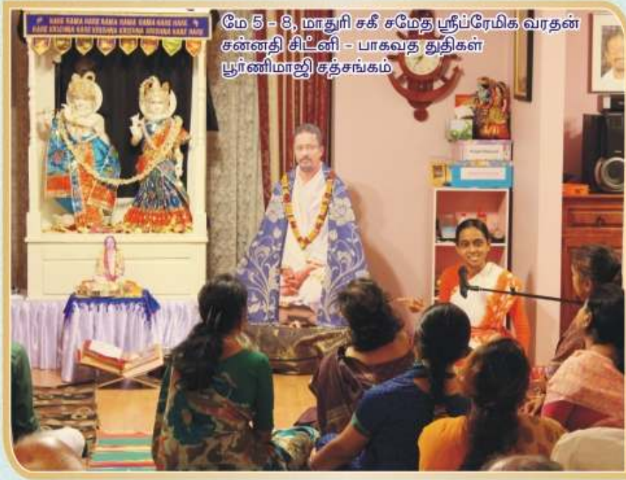
மே 5 - 8, மாதிரி சகீ சமேது ஸ்ரீப்ரேமிக வரதன் சன்னதி சிட்னி - பாகவத துதிகள் ஸ்ரீர்ணிமாஜி சத்சங்கம்