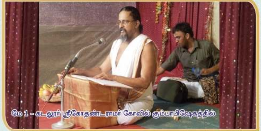
மே 1 - கடலூர் ஸ்ரீகோதண்டராமர் கோவில் சும்பாபிஷேகத்தில்