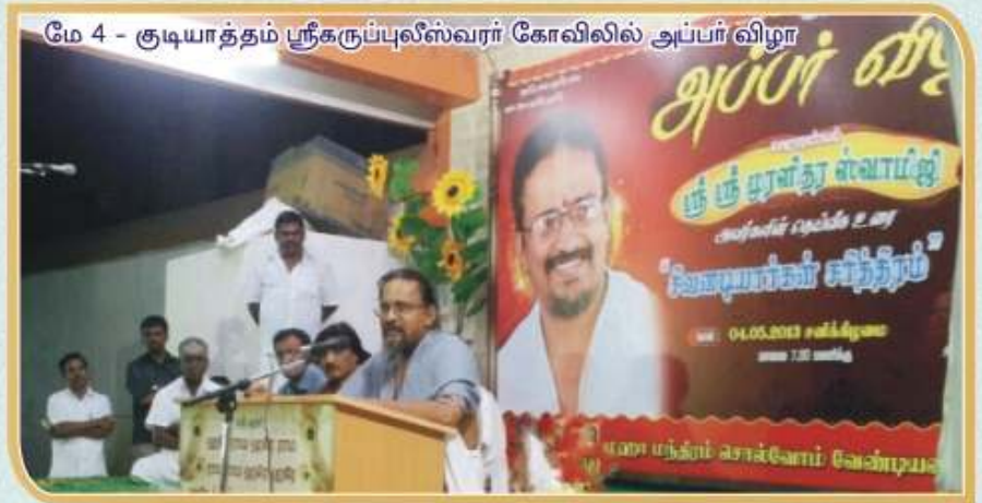
மே 4 - குடியாத்தம் ஸ்ரீகருப்பலீஸ்வரர் கோவிலில் அப்பர் விழா