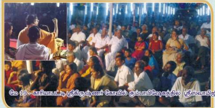
மே 19 - காரியாபட்டி ஸ்ரீகிருஷ்ணர் கோவில் சும்பாபிஷேகத்தில் ஸ்ரீஸ்வாமிஜி